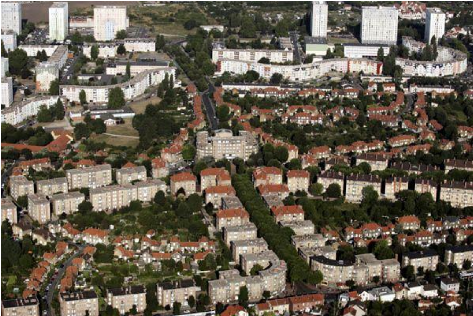
Seine-Saint-Denis - vue aérienne de la Cité-jardin