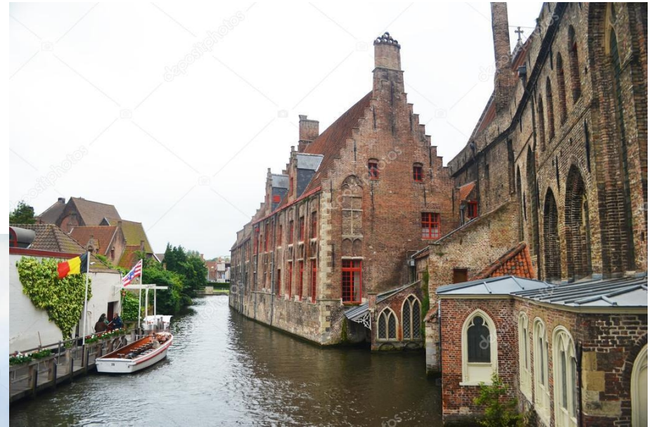
médiévale de Bruges (Belgique)