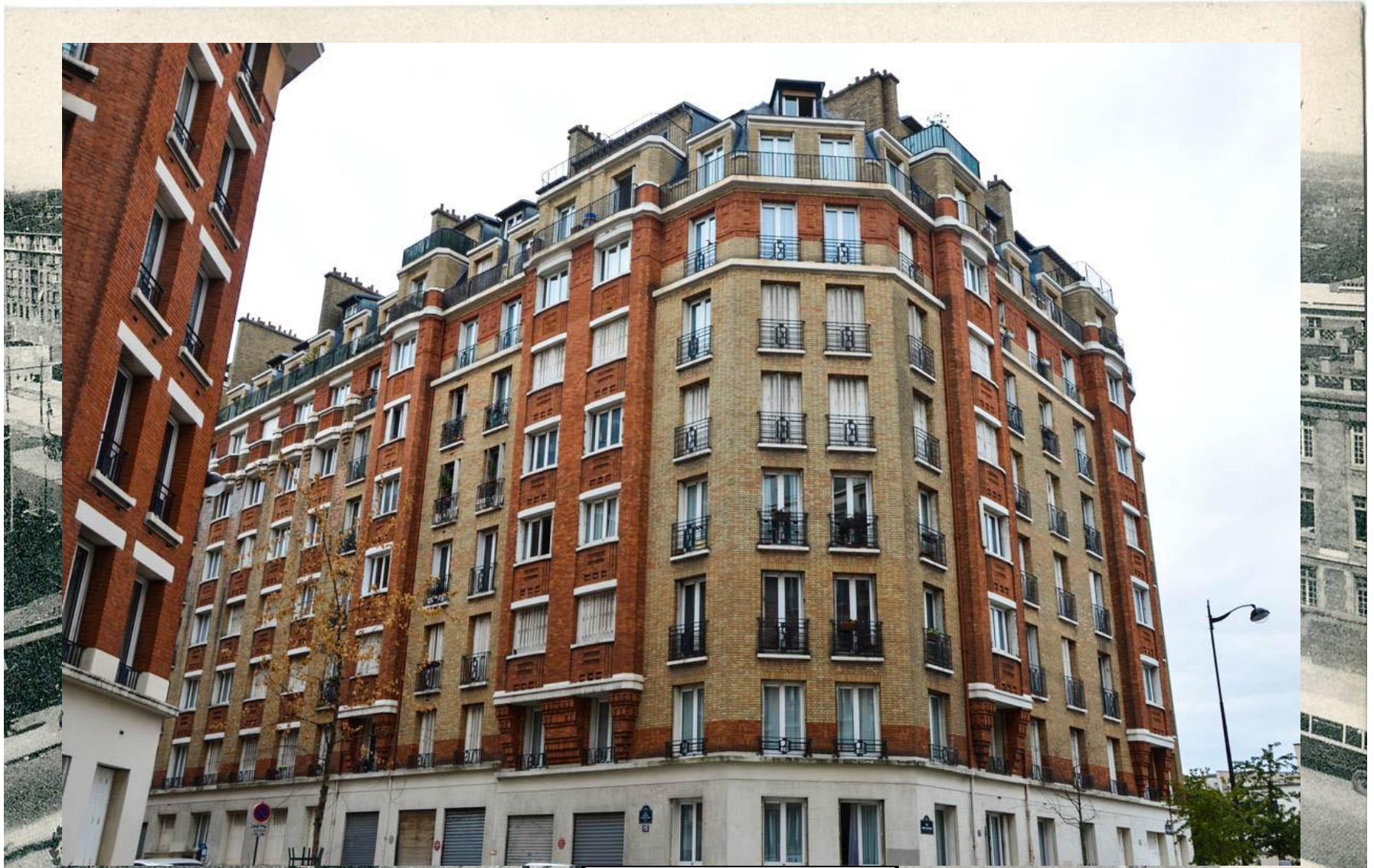
Les H.B.M de Paris