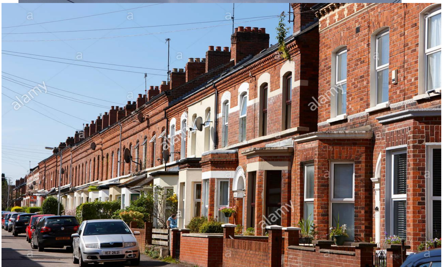
logements en bandes