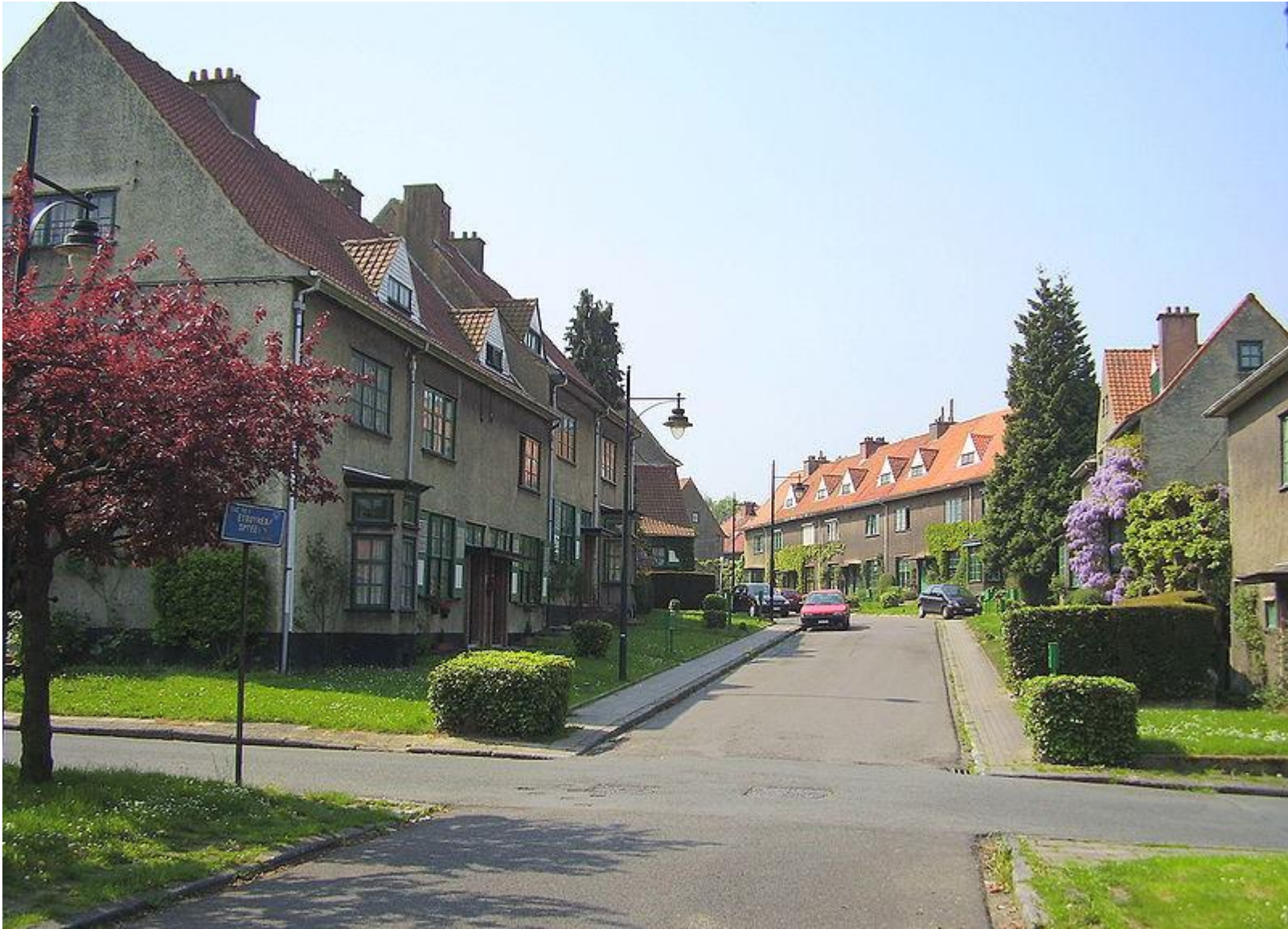
Cité-jardin Le Logis , Watermael-Boitsfort (Bruxelles)